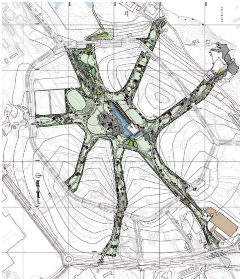
Landskapsplan. Ill. Bjørbekk & Lindheim