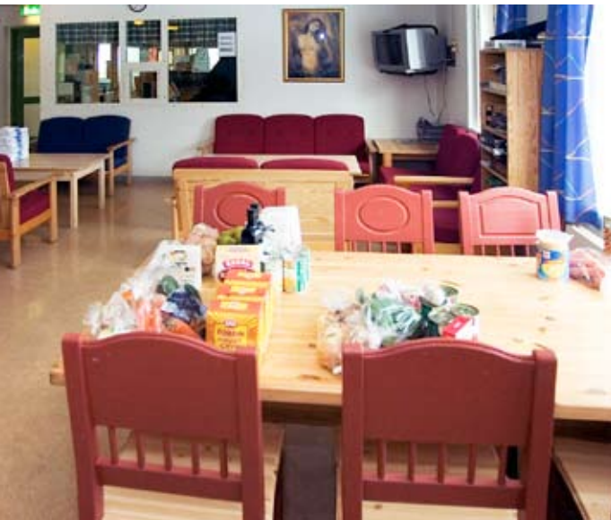
Slik ser et vanlig fellesrom ut i de forskjellige enhetene. Her er det nettopp kommet nye forsyninger.