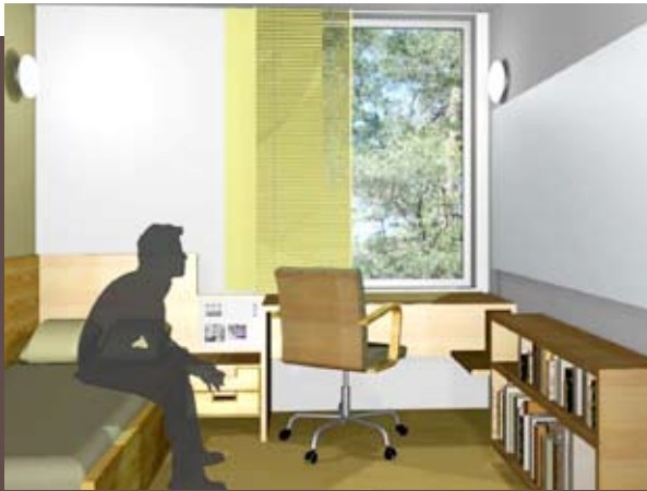
Slik ser Statsbygg for seg at cellene blir seende ut når de står ferdig.