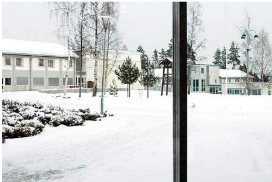
Slik er utsikten fra en av cellene.