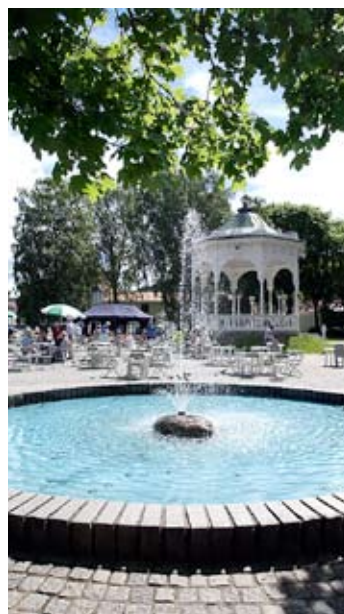
Idylliske Busterudparken – en grønn «lunge» i sentrum.

Høgskolen i Østfold er lokalisert på Remmen i Halden. Halden kommune har som strategi å legge til rette for et tettere samarbeid mellom næringslivet og høyskolen.