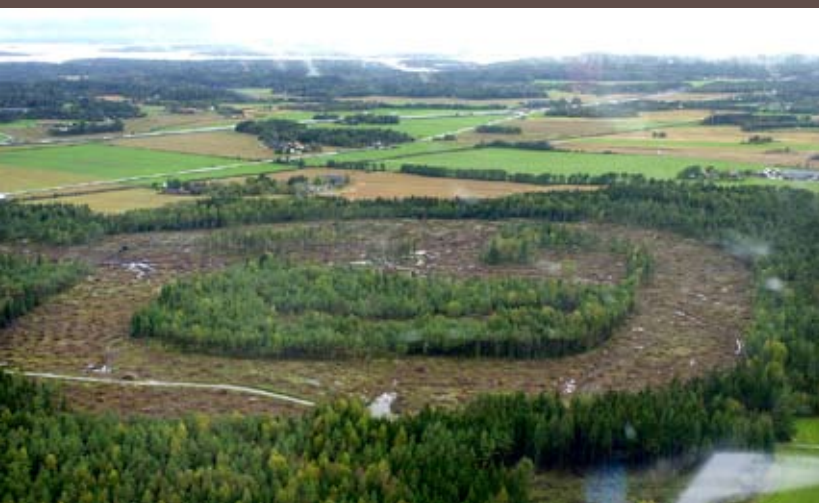
I dette området vil Halden fengsel stå ferdig i april 2010.