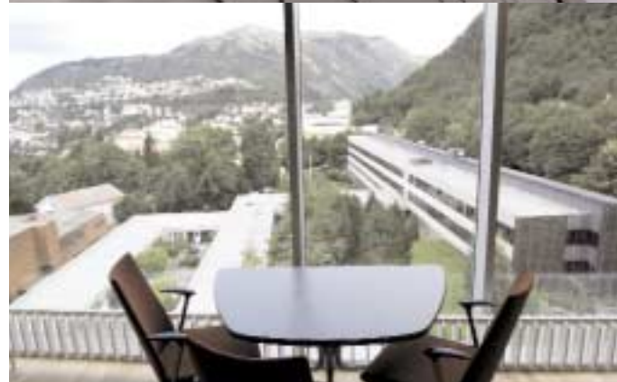
En innvendig glassgård strekker seg fra tredje til åttende etasje. Høyden og glasstaket gir lys og luft. Møterommene i syvende etasje har flott utsikt over noen av Bergens fjell.