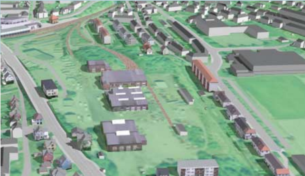
Digital 3D-modell av Kronstadtomta i Bergen, der Høgskulen i Bergen skal samlokaliseras. Forslaga frå prosjektkonkurransen for nytt høgskoleanlegg kan «limast inn» i modellen, og brukast i evalueringa av konkurranseforslaga.

Forskning og utvikling (FoU) skal vere til beste for eigedomsforvaltning og prosjektgjennomføring i Statsbygg. Samstundes skal FoU-prosjekta stimulere til ei bærekraftig utvikling i bygge-, anleggs- og eigedomsnæringa.