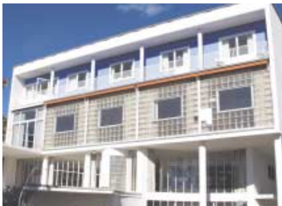
Mange av de opprinnelige glassbyggersteinene i fasaden på Villa Stenersen har begynt å sprekke.

Produksjon av glassbygggestein gjøres vanligvis maskinelt, men siden glassbygggesteinen til villaen håndlages er dette et pilotprosjekt, ikke bare i Norge, men også i verdenssammenheng.