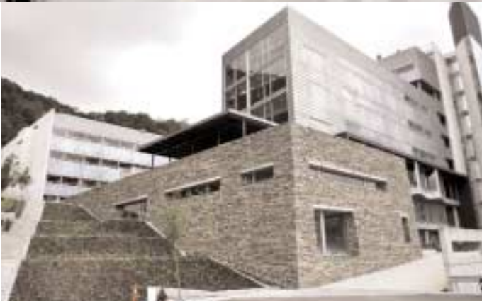
Bygget er forbundet til Haukeland sykehus med en gangbro. Nærheten til klinikken var et av hovedargumentene for å flytte de prekliniske instituttene.

loger er involvert i dette. I egne laboratorier skal det gjøres neurologiske forsøk, blant annet relatert til langtidseffekter av dykking. – Jeg regner med at vi vil bruke høsten til å teste laboratoriene og bearbeide våre egne rutiner, og være i full drift neste semester, forteller Murison, som fortsatt står til knes i esker og pakker. Mye nytt utstyr er kommet fra utlandet de siste dagene. I forsøksdyravdelingen arbeider forskere med smittestoffer som ikke skal lekke ut i resten av bygget. Derfor transporteres dyrene i en egen heis som kun går til dyreavdelingen. Når de ansatte skal inn og ut av laboratoriene, må de gjennom en sluse der de skifter klær. Dette gjøres for at de ikke skal bringe med seg allergener – stoffer fra dyrene som kan framkalle allergi – ut i resten av bygget. Et komplisert ventilasjonssystem sikrer at smittestoff ikke slipper ut av rommene gjennom luftkanalene.