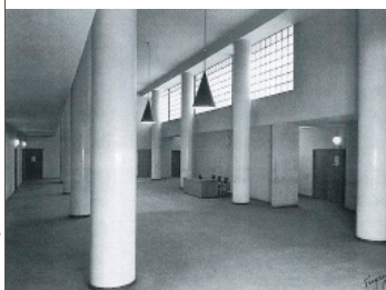
1. etasje 1948

Bygningen er mest kjent for søylehallen i første etasje. Hallen var tidligere publikumsareal, omkranset av retts-saler. I rettsalene og noen forrom ble glassbyggerstein brukt i himlingene for å gi overlys til lokalene. Etagens oppover i huset var benyttet til dommerkontorer. Syvende etasje med inntrukket fasade og takterrasse var benyttet til kantine, visgesal og rettssal.