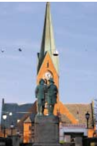
Vår Frelses kirke fra 1901.