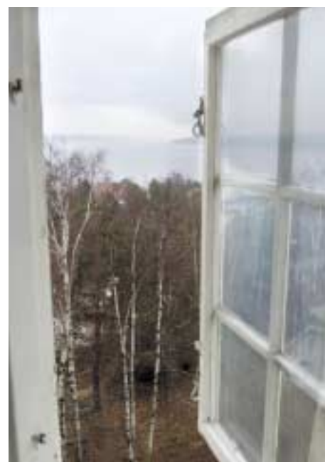
Quislings kontor i andre etasje hadde vid utsikt over fjorden.

Huset ble brukt som privatbolig for Maria og Vidkun Quisling fra 1941 til 1945, men det fungerte også som kontor og representasjonslokaler. Her ble det holdt samlinger og offisielle mottakelser gjennom hele krigen. Quislings kontor i andre etasje hadde vid utsikt over fjorden. Herfra så han kanskje med egne øyne skipene som fraktet norske jøder til Tyskland og konsentrasjonsleirene.