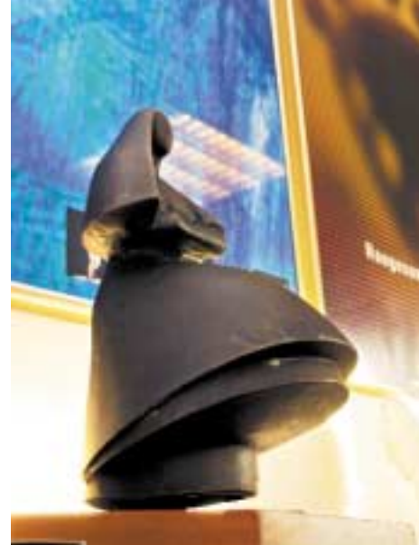
Amanda filmfestival har internasjonal ry.