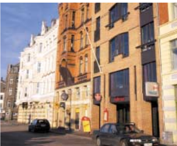
Byen har mange urbane kvaliteter.