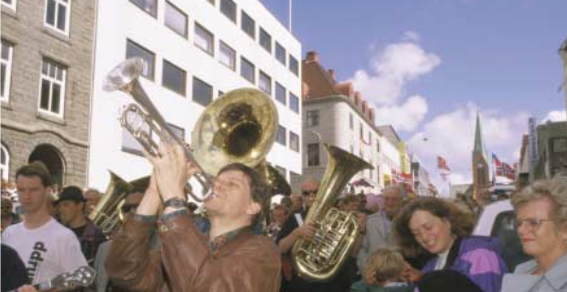
Gateparade under Sildajazz-festivalen.