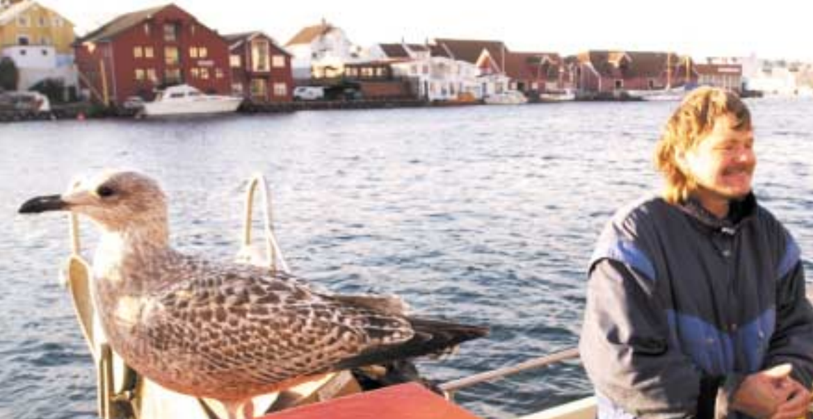
I havna treffer vi måker og folk.