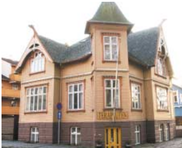
Trehus med ornamenten er et kjent trekk ved byen.