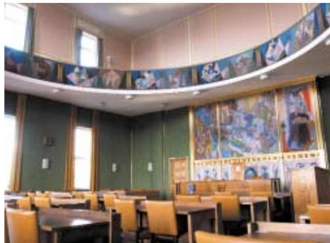
Interiør fra rådhuset i Haugesund.

FILMFESTIVAL Haugesundere er internasjonalt orientert, påstår ordføreren. Lytt til Vamp, for eksempel. Slektskapet med irsk musikk er tydelig. Alle vet hvor London er, men ber du dem om å finne Hamar på kartet, blir det straks verre. Tro på egen evne til å markere seg i europeisk sammenheng har de også.