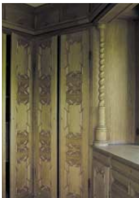
Detalj fra Maria Quislings smykkerom som er rikt dekorert med utskjæringer.