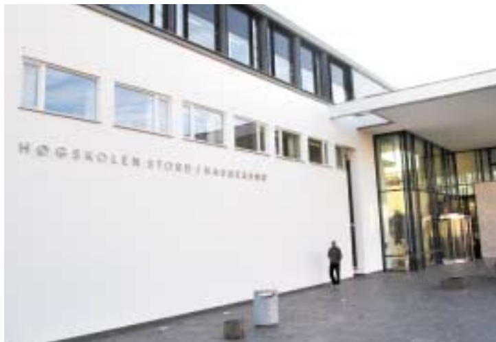
Høgskolen i Haugesund.