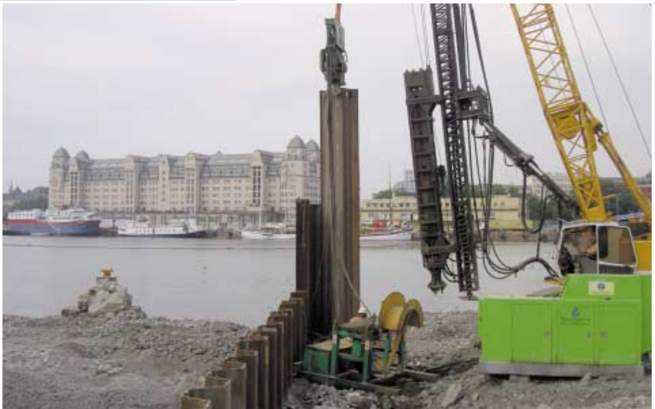
Arbeidet med å slå ned tilsammen 28 kilometer pæler i Bjørvika har begynt.