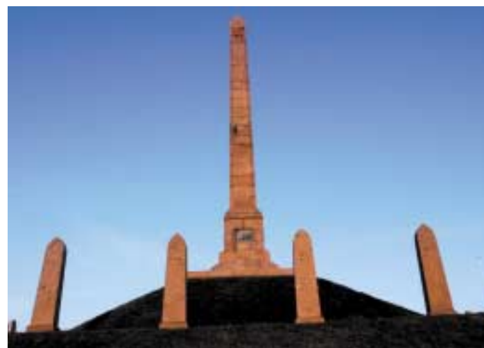
Haraldshaugen, i følge Snorre er det her Harald Hårfagre ble begravet.