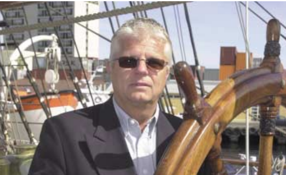
Sjøfartsdirektøren i maritimt miljø ved Kristiansand havn.