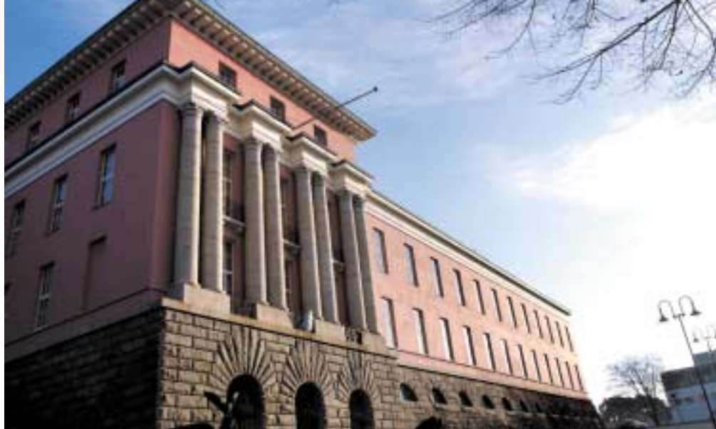
Rådhuset ble gitt av Skipsreder Knut Knutsen.