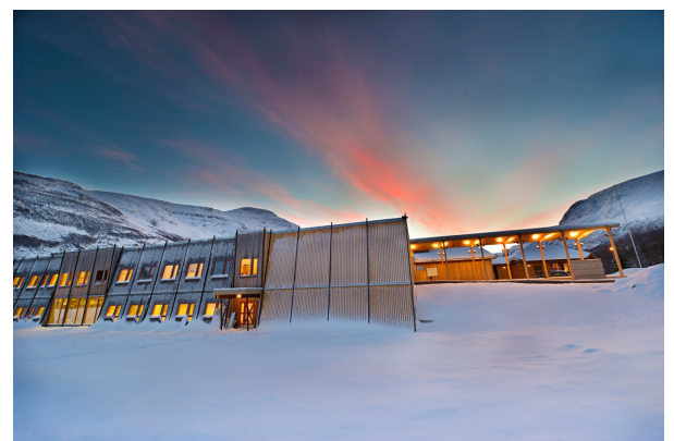
Senter for nordlige folk / Davi álbmogiid guovddáš Arkitekt: Stein Halvorsen AS